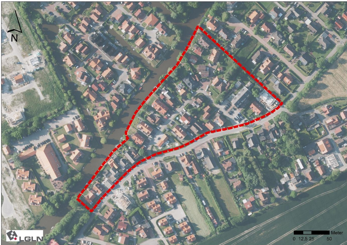
Abbildung 2: Luftbild

Stellvertretend für die vorkommenden Tiere, Pflanzen und für die biologische Vielfalt werden nachfolgend die Biotoptypen nach Drachenfels (2021) beschrieben.